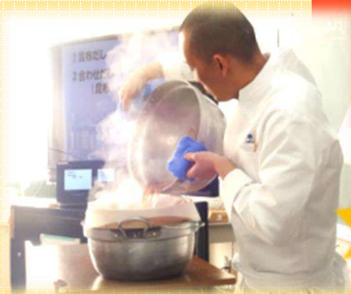
だしの引き方の実演