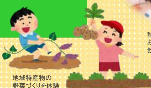
地域特産物の 野菜づくりを体験