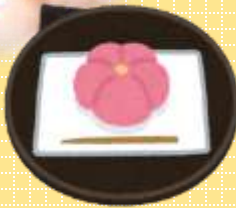
和菓子づくりや お茶の淹れ方・ 飲み比べ体験