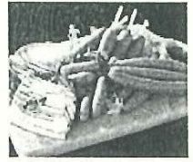
岩手県産「ハム・ソーセージセット」