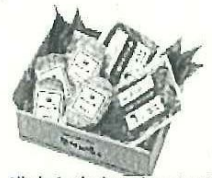
漢方和牛まんきつセット