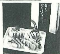
鹿児島県産「かんばち4兄弟」