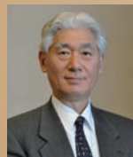
熊倉 功夫 一般社団法人和食文化 国民会議会長 静岡文化芸術大学学長